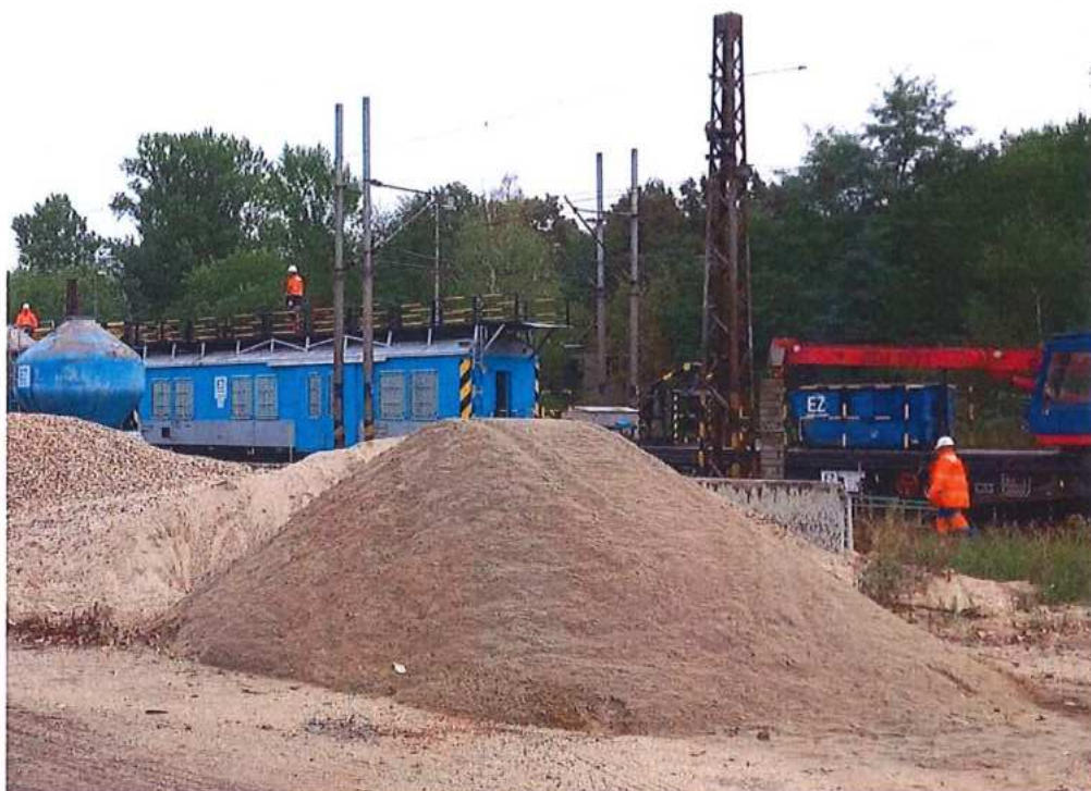
Demontáž trakčného vedenia – SO 10-35-01