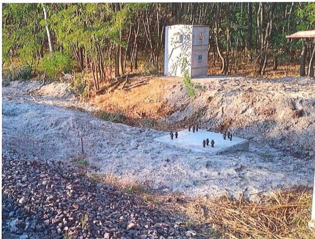
Nový základ trakčnej podpery – SO 10-35-01