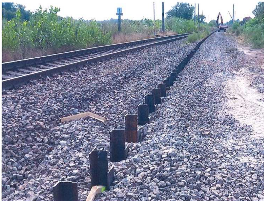
Baranenie zápor HEB v ose koľají v km 71,600- 72,300 – SO 11-32-02