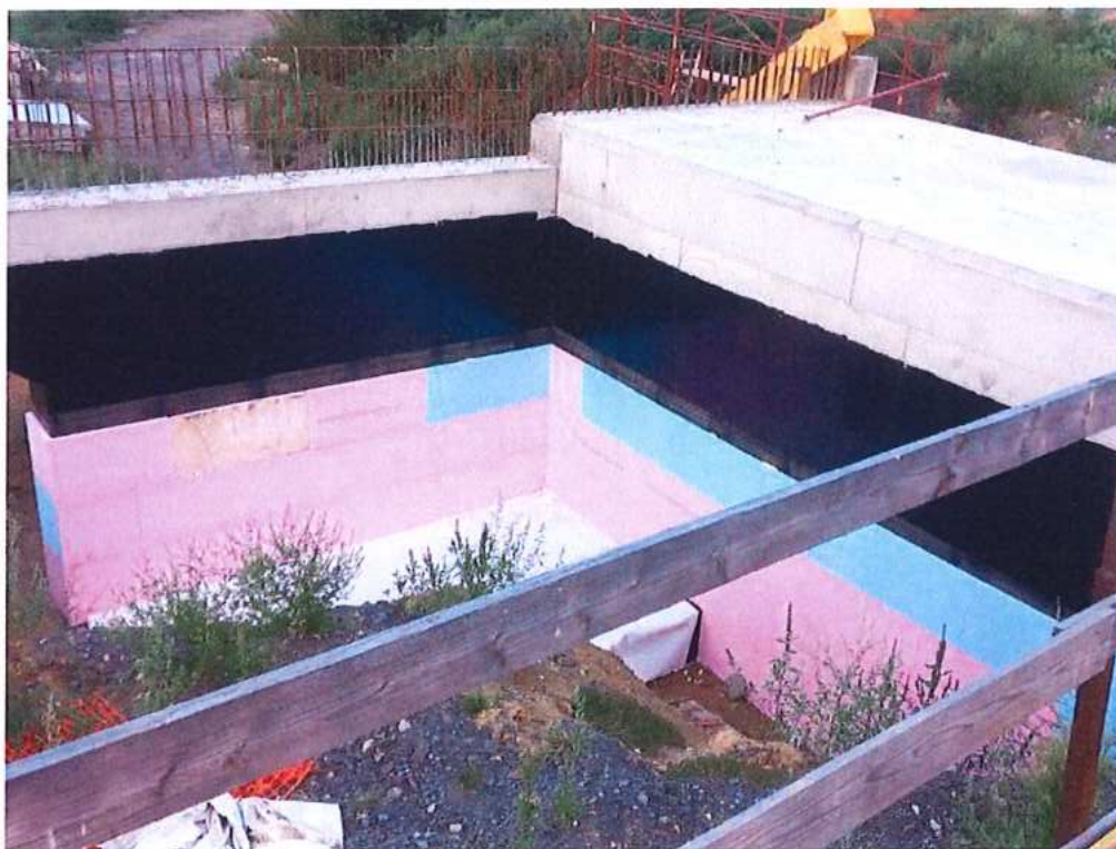
Ochrana izolácie – SO 12-33-05