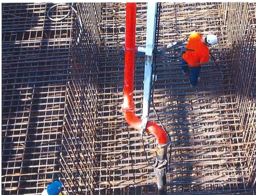
Betonáž základu č.2 CZ strana – SO 12-33-04