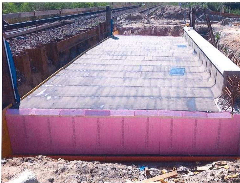
Izolácia stropnej dosky podjazdu – SO 11-33-04