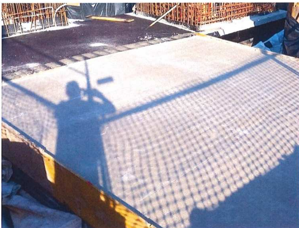
Ochrana izolácie stropnej dosky podchodu – SO 11-33-01