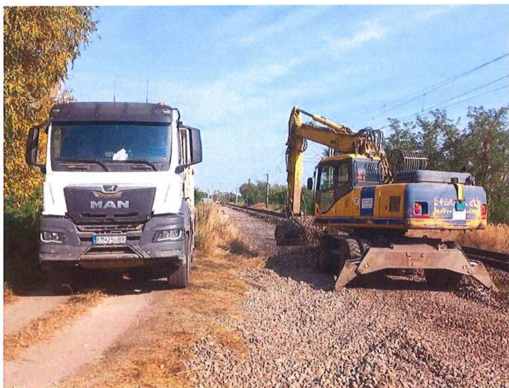
Odkop starého štrkového lôžka do km 71,500 – SO 10-32-03