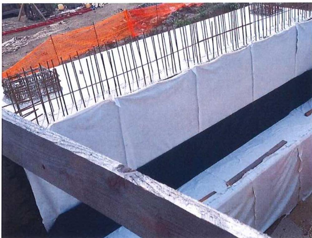
Oddebnenie drieku opory č.2 CZ strana – SO 12-33-04