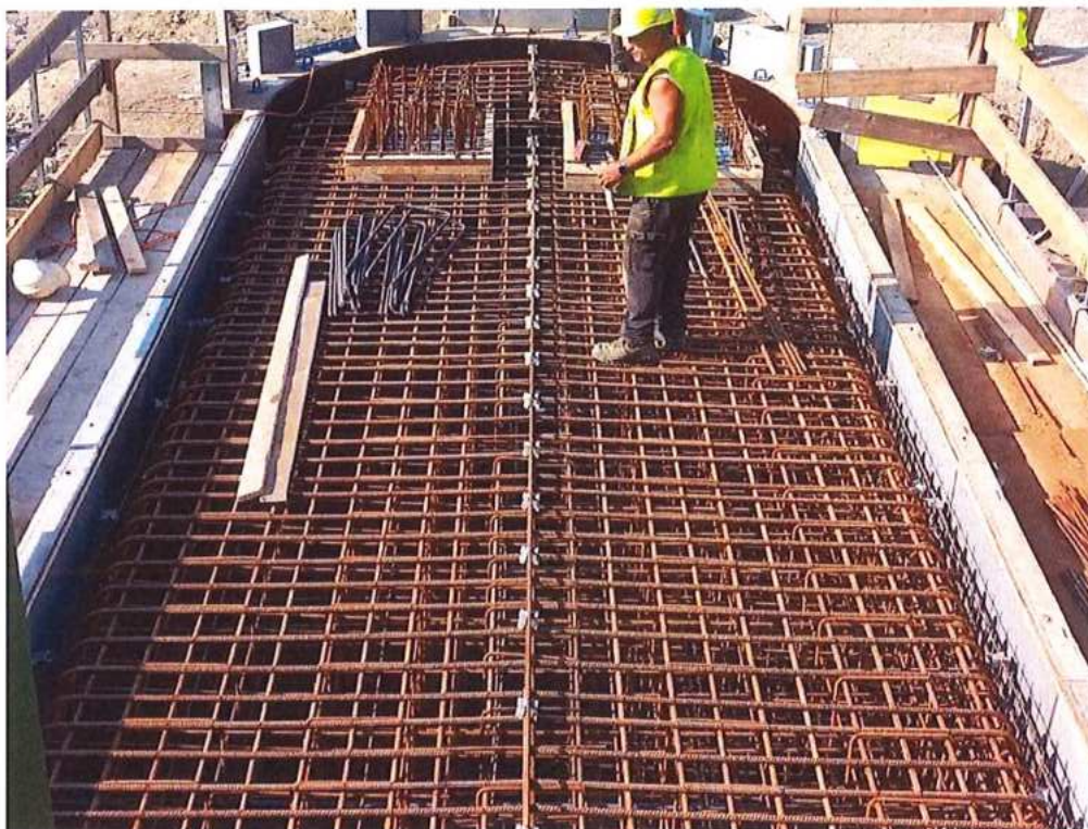
Armovanie piliera č.1 SK strana – SO 12-33-04