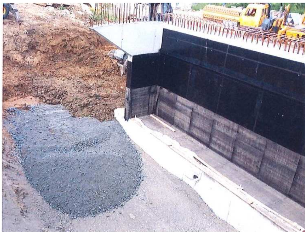
Zásyp opory č.1 SK strana – SO 12-33-04