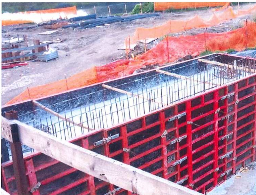
Zabetónovaný driel opory č.2 CZ strana – SO 12-33-04