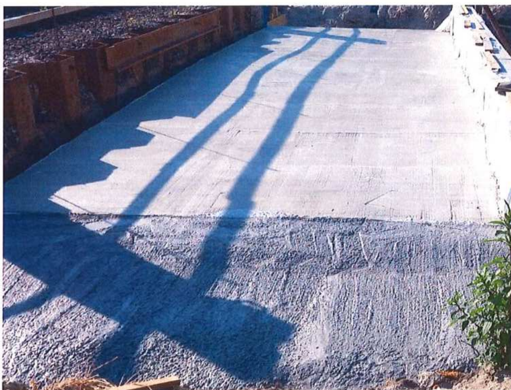
Ochrana izolácie stropnej dosky podjazdu – SO 11-33-04