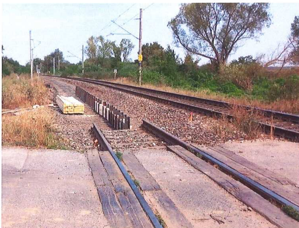
Vkladanie pažiacej výdrevy do zápor HEB – SO 11-32-02