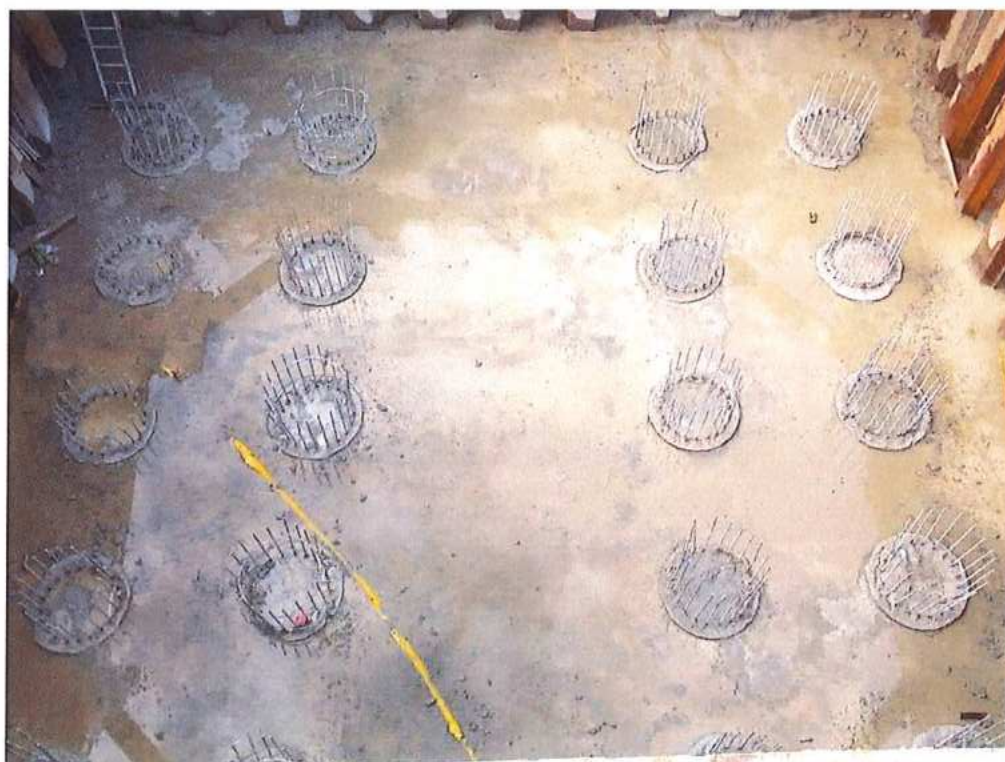
Búranie hláv pilót - základ č.2 CZ strana – SO 12-33-04