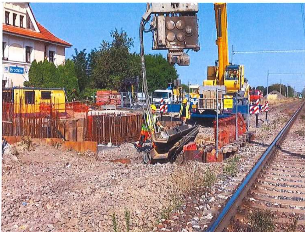
Demontáž larsen – SO 11-33-01