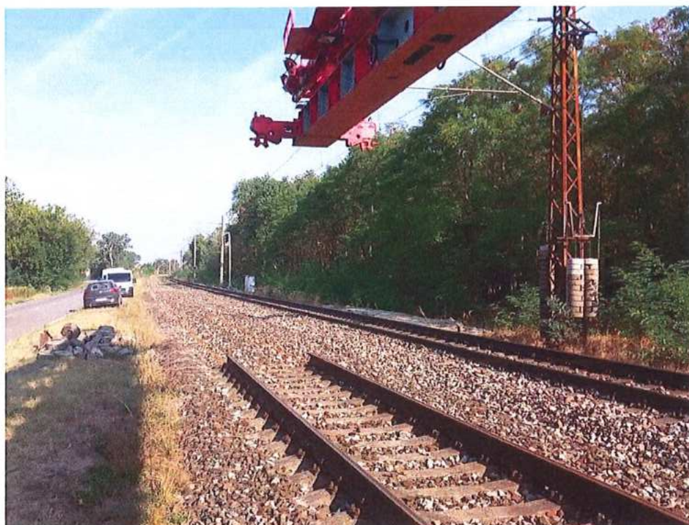
Demontáž koľajových polí do km 70,720 – SO 10-32-03