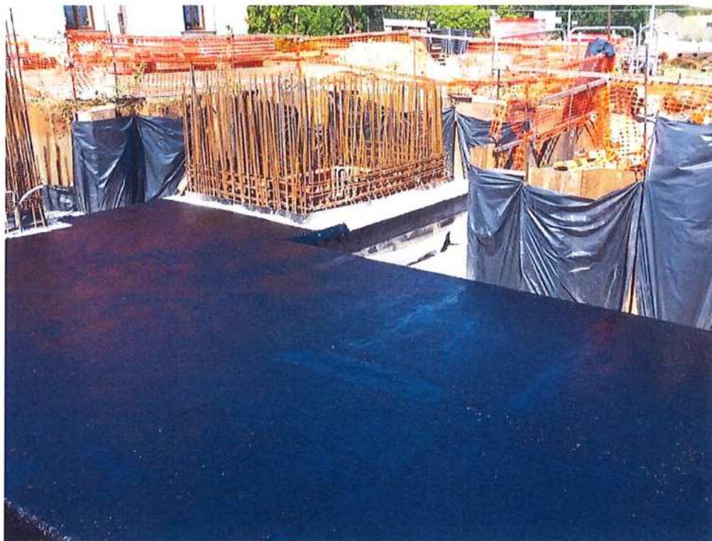
Izolácia stropnej dosky podchodu – penetračný náter – SO 11-33-01