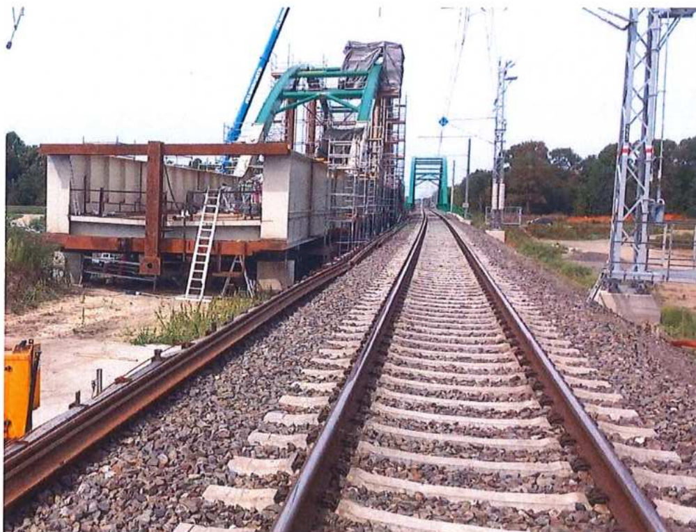
Montáž a náter oc. konštrukcie mosta – SO 12-33-04