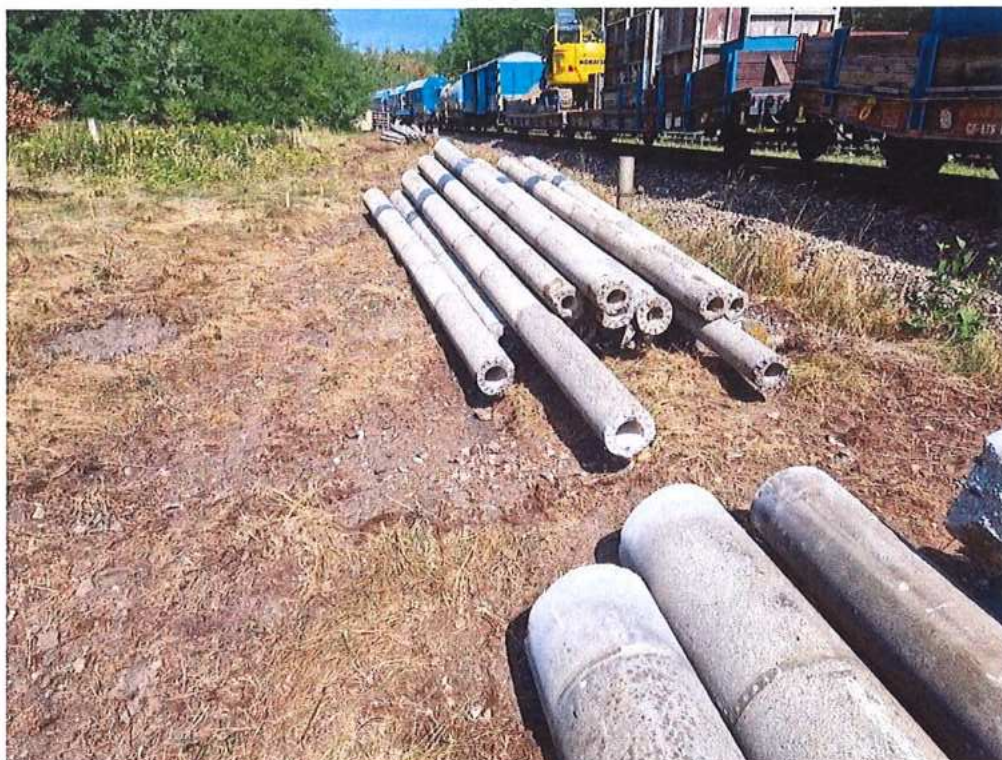
Demontované trakčné podpery – SO 10-35-01