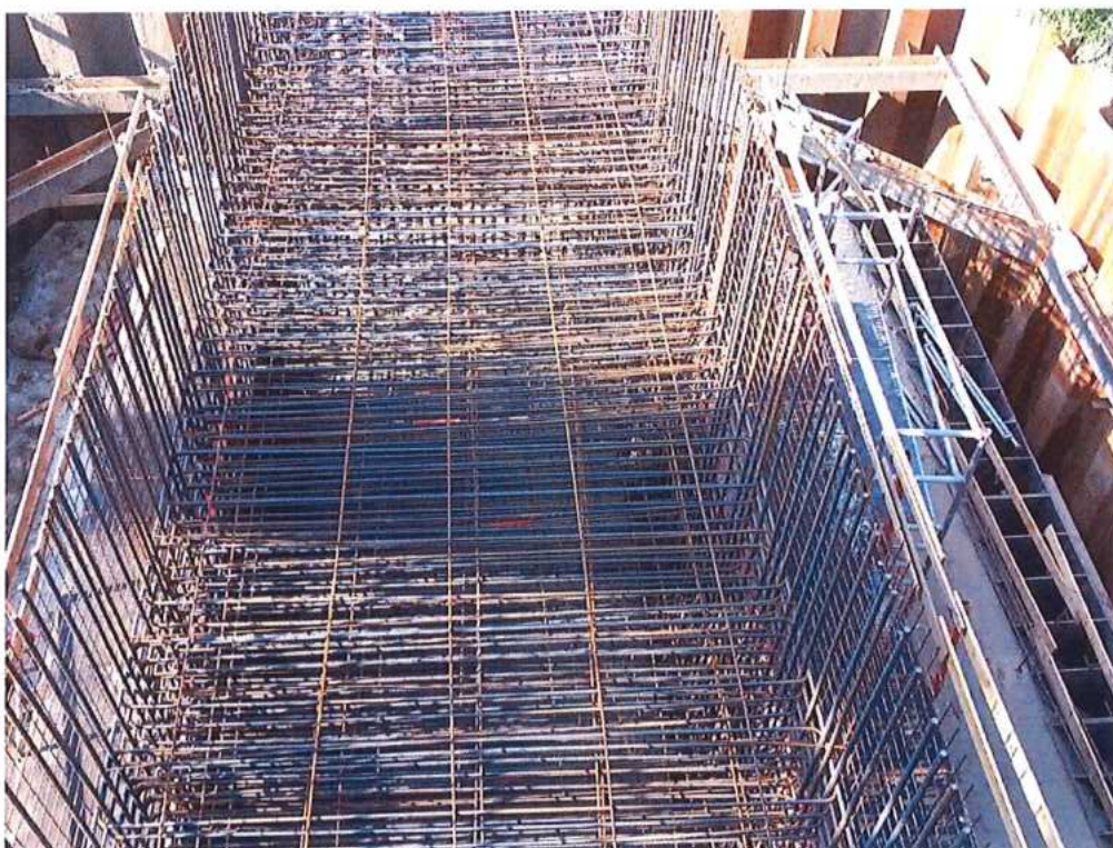
Armovanie piliera č.2 CZ strana – SO 12-33-04