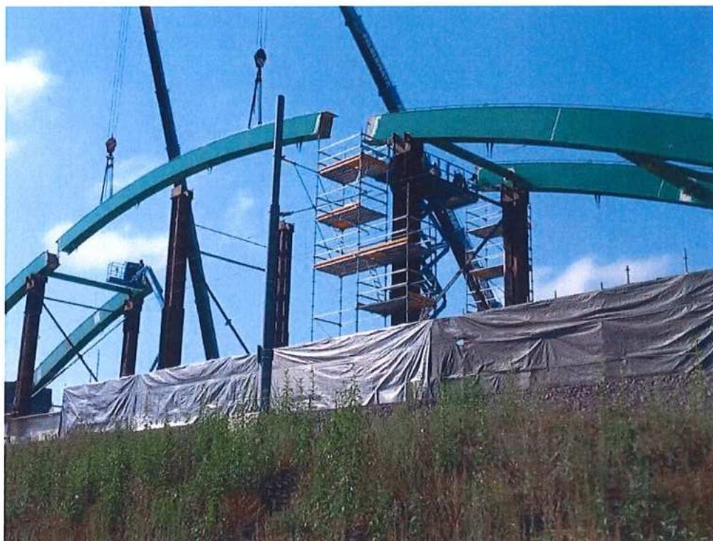
Montáž oc. konštrukcie – SO 12-33-04