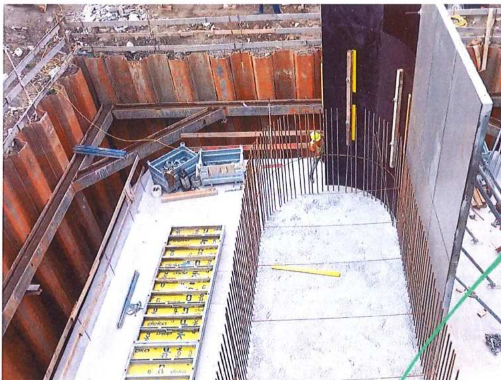
Debnenie piliera č.1 SK strana – SO 12-33-04