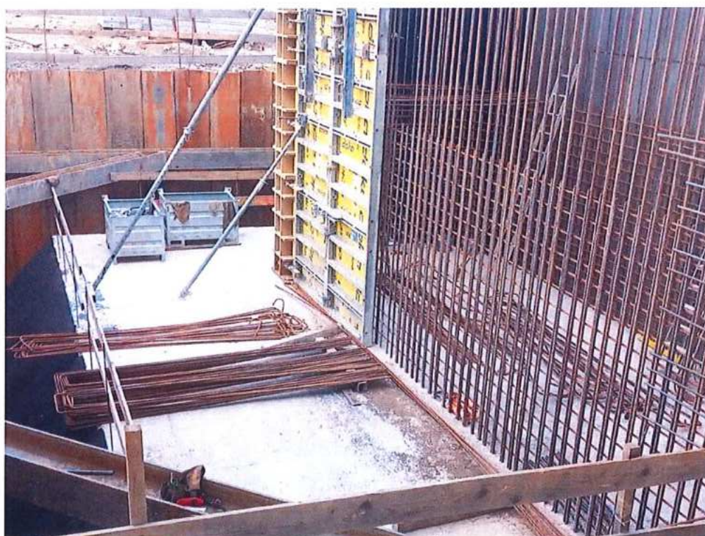
Debnenie a armovanie piliera č.1 SK strana – SO 12-33-04