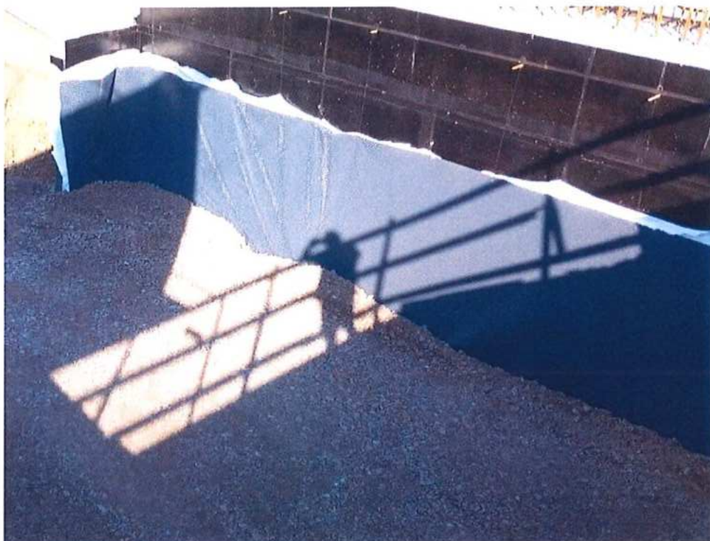
Zásyp opory č.1 SK strana – SO 12-33-04